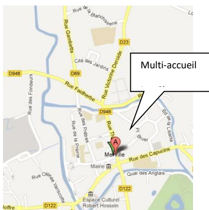
Plan du centre-ville de Merville

La petite crèche « les chatons » se situe au centre de Merville, 56 rue des Prêtres. Elle est donc accessible et dispose d'un emplacement idéal. Etant proche de trois écoles également, elle permet d'être un service conciliant pour les familles ayant des fratries dans ces établissements sans avoir à traverser la commune.