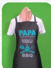
Tablier : 15€