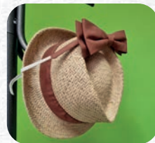
Noed papillon : sur devis