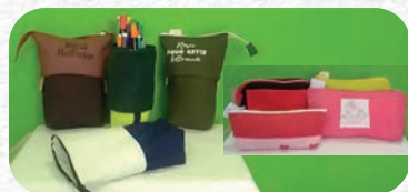
Trousse pot : 12€ Trousse diverses : à partir de 6€