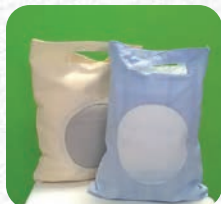
Sac cadeau : 7€