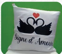
Coussin : 15€