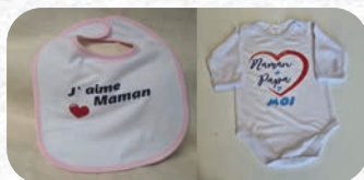
Bavoir 8€ / Body 12€