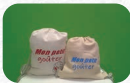
Sac à goûter : 12€