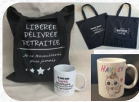
Tote bag : 10€ / Mug : 10€