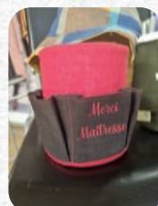
Pot à crayons : 15€

📍 24 place de la Libération - Merville ✉️ aucasou@ville-merville.fr ☎️ 03 28 40 07 84 📘 /aucasoumerville