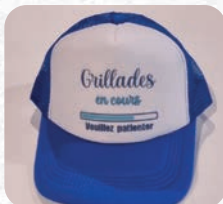
Casquette : 12€