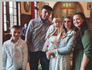
Sinaya Bouchery Le 10 juillet 2021