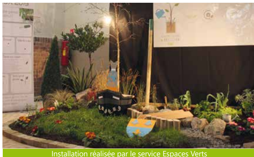
Installation réalisée par le service Espaces Verts