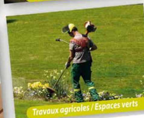
Travaux agricoles / Espaces verts