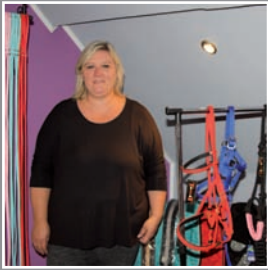
Sellerie de l'Astre